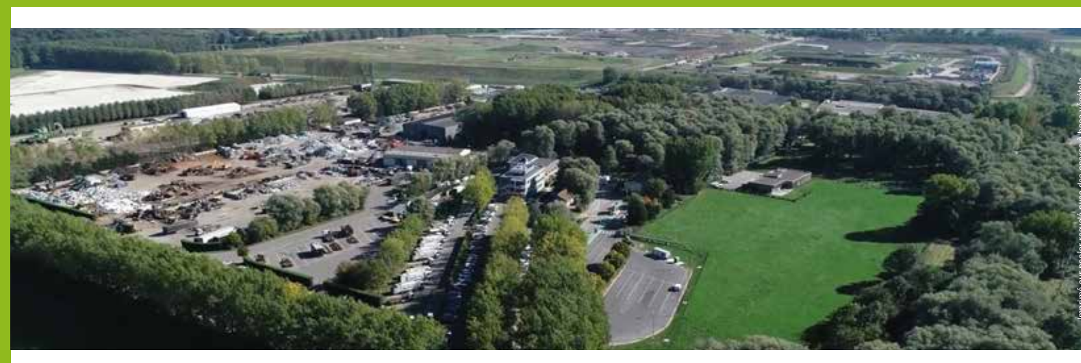
Imprimé sur papier recyclé avec des encres à base végétale.

Rassemblées sur un même site, l'Éco-parc de Blaringhem (Nord), les diverses installations du groupe Baudalet Environnement fonctionnent en totale synergie : les refus de tri et les sous produits des unes deviennent les ressources des autres. Ce modèle éco-industriel, exemple unique en Europe d'économie circulaire, illustre la volonté du groupe d'aller toujours plus loin dans la valorisation des déchets.